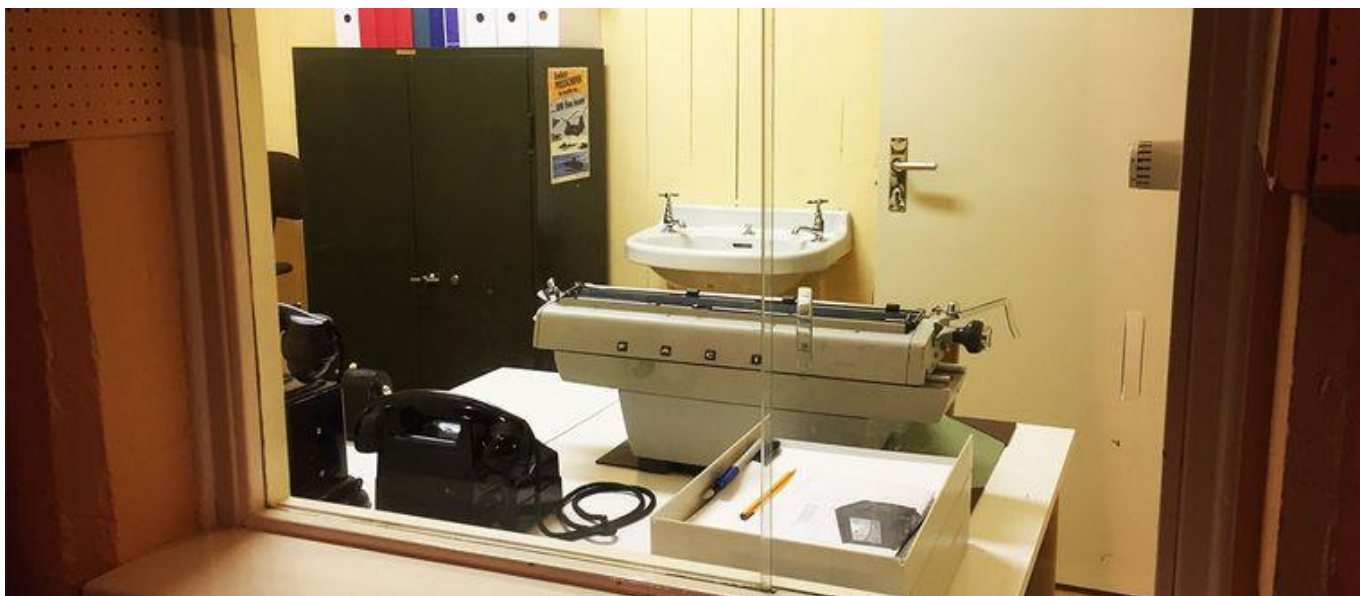
En bunker fylld av tidstypiska interiörer från kalla krigets dagar

Här finns flera rum för kök, vila, fläktar och teknisk utrustning – och längst in ligger taktikrummet med telefoncentral och kartor.