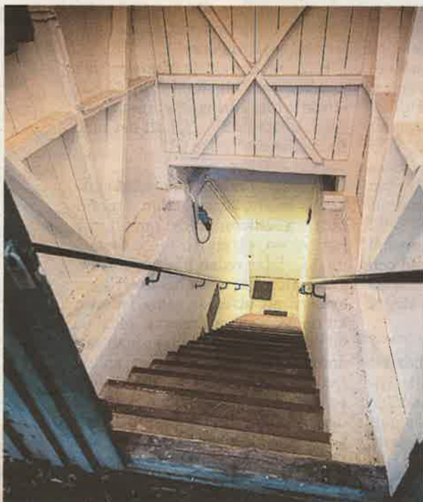
Dörren till det lilla skjulet öppnas mot en brant trappa som leder ner mot centralen som består av flera rum.